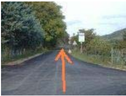
Km 6,4 - 408 mslm

All'altezza della stazioncina si attraversano la ferrovia e la strada asfaltata proseguendo lungo la sterrata in piano e passando accanto alle strutture di una centrale Enel