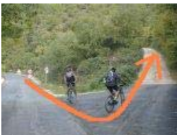
Km 10,3 - 404 mslm

Al bivio si tiene la sinistra. Si sale inizialmente per poi proseguire con alcuni saliscendi per 3,5 km su fondo recentemente asfaltato