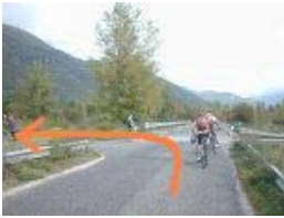
Km 0,5 - 418 mslm

Si gira a sinistra sulla sterrata che percorre l'argine sinistro del fiume. Si pedala in piano su buon fondo per più di tre km fino ad incontrare il ponte sulle trasparenti acque del Peschiera, affluente del Velino