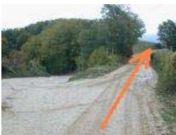
Km 15,4 - 828 mslm

Si incrocia un'altra sterrata in corrispondenza di un pallo della luce. Si gira a sinistra