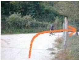
Km 3,7 - 410 mslm Si gira a destra

Si gira a sinistra sulla sterrata che percorre l'argine sinistro del fiume. Si pedala in piano su buon fondo per più di tre km fino ad incontrare il ponte sulle trasparenti acque del Peschiera, affluente del Velino