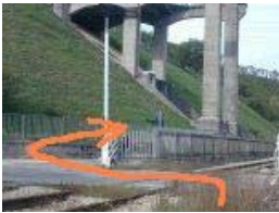
Km 3,8 - 410 mslm

All'altezza della stazioncina si attraversano la ferrovia e la strada asfaltata proseguendo lungo la sterrata in piano e passando accanto alle strutture di una centrale Enel