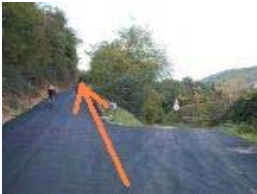
Km 6,8 - 415 mslm

All'incrocio si prosegue dritto lungo la strada asfaltata di recente