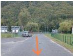
ponticello sul Velino