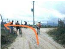
Km 15,1 - 827 mslm

Si lascia la strada asfaltata per girare a sinistra in salita su sterrato. Un cartello indica "Madonna dei balzi". Dopo 1 km si tralascia la deviazione per il santuario e si continua a pedalare in salita superando alcuni tratti faticosi